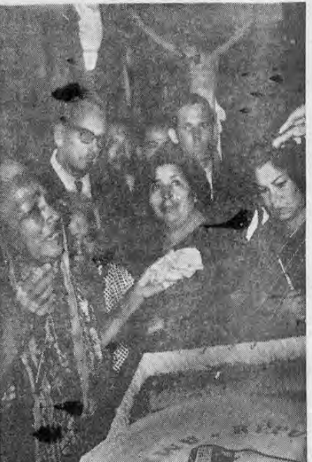
Una mujer del pueblo mira al Presidente muerto...