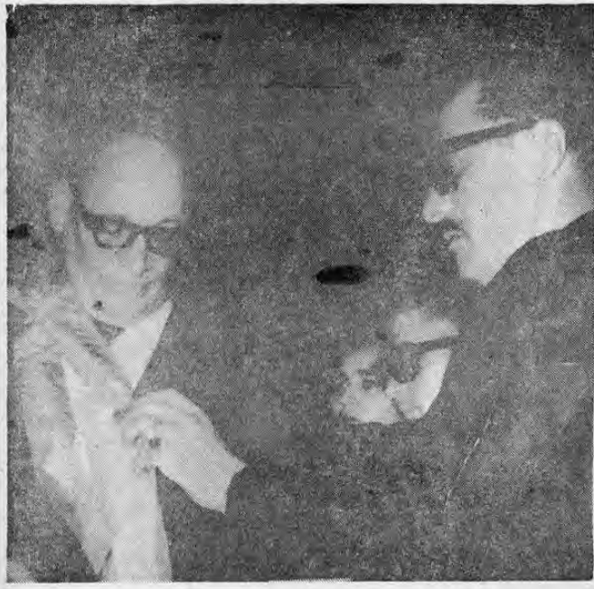
El Presidente del Congreso Nacional de Nicaragua Dr. Orlando Montenegro Medrano impone la banda presidencial nicaragüense al vice-Presidente Dr. Lorenzo Guerrero Gutiérrez, al asumir el cargo por el fallecimiento de René Schick.

Nuestro enviado especial en Nicaragua, en conversación telefónica con la Redacción de LA REPUBLICA nos dijo que el nuevo Presidente Dr. Lorenzo Guerrero había sido hospitalizado para un rápido chequeo, y que estaba siendo examinado por los mismos médicos que llegaron de Estados Unidos para atender el desaparecido Presidente Schick.